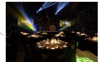
700명 연회장 천장 높이 10m